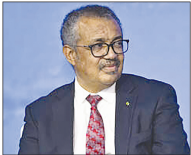
دبیرکل سازمان جهانی بهداشت خاطرنشان کرد که تعداد مرگ و میرهای گزارش شده در هفته اکنون

«تدروس آدهانوم قبریسیوس»، دبیرکل سازمان جهانی بهداشت (WHO) اعلام کرد که همه‌گیری کووید ۱۹ تا پایان سال جاری میلادی (۲۰۲۳)، دیگر یک «وضعیت اضطراری بهداشتی جهانی» در نظر گرفته نخواهد شد. به گزارش ایسنا به نقل از راشاتودی، تدروس در سخنرانی خود در دانشگاه میشیگان گفت که مطمئن است در مقطعی از سال جاری می‌توانیم بگوییم که وضعیت بیماری کووید ۱۹ به عنوان یک نگرانی سلامت عمومی در سطح بین الملل و به عنوان یک بیماری همه گیر به پایان رسیده است. دبیرکل سازمان جهانی بهداشت خاطرنشان کرد که تعداد مرگ و میرهای گزارش شده در هفته اکنون