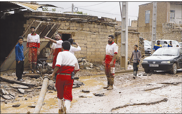
داد و افزود: بر این مبنا به مردم در رابطه با حفظ فاصله با حریم رودخانه‌ها و به

مدیرعامل جمعیت هلال احمر خراسان جنوبی گفت: امدادگران جمعیت هلال احمر خراسان جنوبی به سیل‌زدگان سه شهر مرزی استان امداد رسانی کردند.