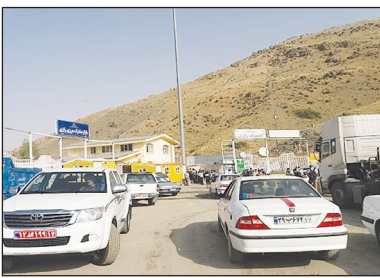
مرزی استان با ۶۷.۲۷ درصد افزایش نسبت به مدت مشابه سال قبل، به ۵۵ هزار و ۶۹۶ دستگاه و خروج تعداد ناوگان حامل کالای ترانزیتی از پایانه‌های مرزی

استان با ۱۵۸۵ درصد افزایش به بیش از ۴۹ هزار دستگاه رسید. دست نفلان خاطر نشان کرد:طی یکسال گذشته در مجموع ۱۵ هزار و ۹۵۶ دستگاه اتوبوس از پایانه‌های مرزی استان تردد کردند. وی با اشاره به اینکه پایانه مرزی بازرگان با بیش از ۲۰۳ هزار تردد، رتبه نخست تردد ناوگان باری را در بین سایر پایانه‌های مرزی استان طی یکسال گذشته داشته است، یاد آور شد: در این مدت مجموع کامیون‌های حامل کالاهای وارداتی و صادراتی از پایانه‌های مرزی استان به بیش از ۳۳۵ هزار رسید که کامیون حامل کالاهای صادراتی ۲۵۶ درصد رشد را نشان می دهد.