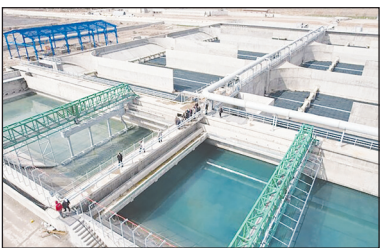
وی خاطرنشان کرد: پروژه تصفیه خانه طبرسی شمالی هم با سرمایه گذاری بخش خصوصی با برآورد ۱،۵۰۰ میلیارد تومان در حال اجرا می‌باشد که پس از پایان ۷۰ هزار مترمکعب بر توان تصفیه خانه‌های شهر مشهد خواهد افزود تا به امروز یک چهارم از عملیات اجرایی و ساخت خود را پشت سر گذاشته و تا پایان سال ۱۴۰۴ بهره برداری خواهد شد.