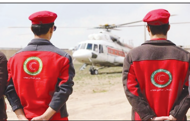
بالا آمدن ناگهانی سطح آب رودخانه‌ها، سیلابی شدن مسیله‌ها و رودخانه‌های فصلی، رعدوبرق و تگرگ، آب‌گرفتگی معابر به صورت گسترده، سرریز سد‌ها، دور از انتظار نیست، امدادگران و نجات گران هلال احمر برای کمک به حادثه دیدگان در آماده‌باش هستند.

این مسئول توصیه کرده از توقف و تردد در بستر و حاشیه رودخانه‌ها و مسیله‌ها خودداری و از سفرهای برون‌شهری و فعالیت‌های کوه‌نوردی اجتناب، شهروندان از تفرح‌گاه‌ها و سکونت‌گاه‌های واقع در حریم و بستر رودخانه خارج شوند.همچنین نامداران و عشاير در ارتفاعات و حاشیه رودخانه‌ها تردد نکنند.