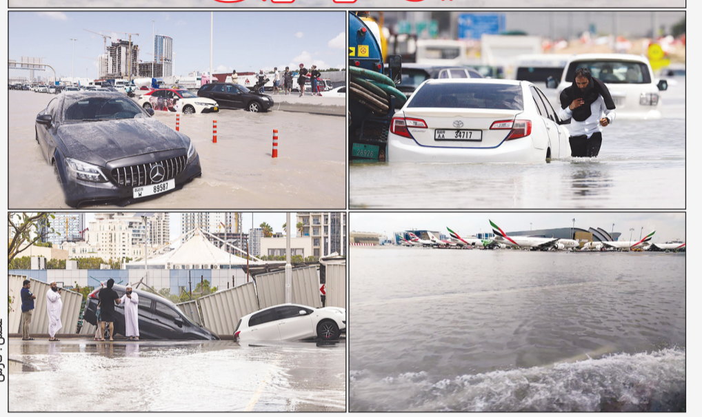
سیل امارات متحده عربی را درنوردیده، بزرگراه های اصلی شهر را مسدود و پروازها را در فرودگاه بین المللی دویچی مختل کرده است؛ دولت، این میزان بارندگی را در ۷۵ سال گذشته بی سابقه توصیف کرده است.