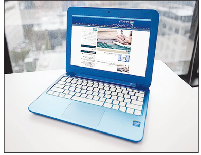
داوطلبان لازم است با مراجعه به سامانه

www.azmoon.org دفترچه راهنمای انتخاب رشته در دریافت کنند. متقاضیان دوره دکتری تخصصی دانشگاه آزاد اسلامی لازم است پس از مطالعه دقیق دفترچه راهنما و در صورت دایر بودن رشته‌گرایش مورد تقاضا در دانشگاه آزاد اسلامی از طریق سامانه مذکور انتخاب رشته کنند.