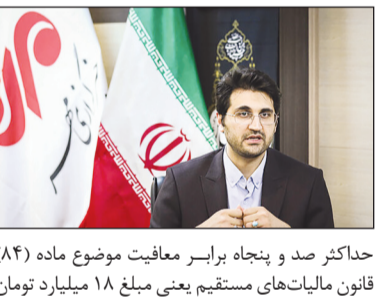
حداکثر صد و پنجاه برابر معافیت موضوع ماده (۸۴) قانون مالیات های مستقیم یعنی مبلغ ۱۸ میلیارد تومان

بوده و رقم مالیات مقطوع برای آن ها در درگاه خدمات الکترونیک سازمان بارگذاری می شود، مشمول مقررات این تسهیلات هستند. گفتنی است صاحبان مشاغلی که از تبصره ماده ۱۰۰ قانون مالیات ها استفاده می کنند، از مزایای عدم مراجعه به ادارات و قرار گرفتن در فرایند طولانی تشخیص و رسیدگی، عدم نیاز به نگهداری اسناد و مدارک و دفاتر، امکان تقسیمی مالیات در بازه های زمانی بیشتر و عدم نیاز به تکمیل جداول درآمد و هزینه (اظهارنامه) برخوردار می شوند.