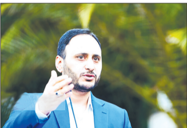
مهرماه سال جاری برای دانشگاه فرهنگیان گلیایگان

پذیرش دانشجو داشته باشد. سختگوی دولت در خصوص معلمان خرید خدمت گفت: نظام جذب معلمان باید ساماندهی و عدالت محور شود به همین دلیل به سمت آزمون گرفتن رفته‌ایم تا رقابت با عدالت باشد. برای معلمی که سر کلاس است و فرصتی برای درس خواندن ندارد امتیازی برای سوابق خدمتی او پیش‌بینی شده است. امیدواریم در این حالت عادلانه تمام خرید خدمتی‌ها بتوانند جذب شوند چراکه تجربه آنها کمک می‌کند که مسیر تدریس را بهتر طی کنند.