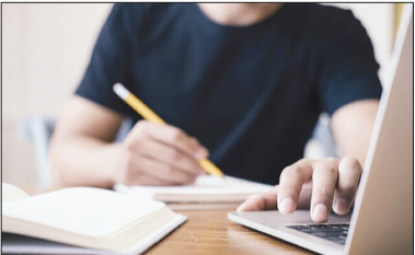
باید حداکثر تا تاریخ ۳۱ شهریور و طی ۸ نیم سال دانشجویان متقاضی (۲۰ درصد برتر دانشگاه تهران و دانشگاه های مشمول فراخوان) نسبت به پذیرش و معرفی تعدادی از متقاضیان اقدام نموده است.

نتایج اولیه پذیرش بدون آزمون استعدادهای درخشان در دوره کارشناسی ارشد سال تحصیلی ۱۴۰۳-۱۴۰۴ اعلام شد.