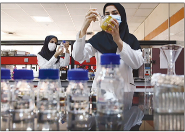
شورای آموزش داروسازی و تخصصی تعیین شده اند. اقدام کنند.

جزییات آیین نامه آموزشی دوره تکمیلی (ارزشیابی) دانش آموزان خارج از کشور در مقاطع تحصیلی دکتری عمومی، کارشناسی ارشد و کارشناسی رشته داروسازی ویژه رشته در مجموع ۲۸۱ هزار و ۲۴۶ متقاضی شد.