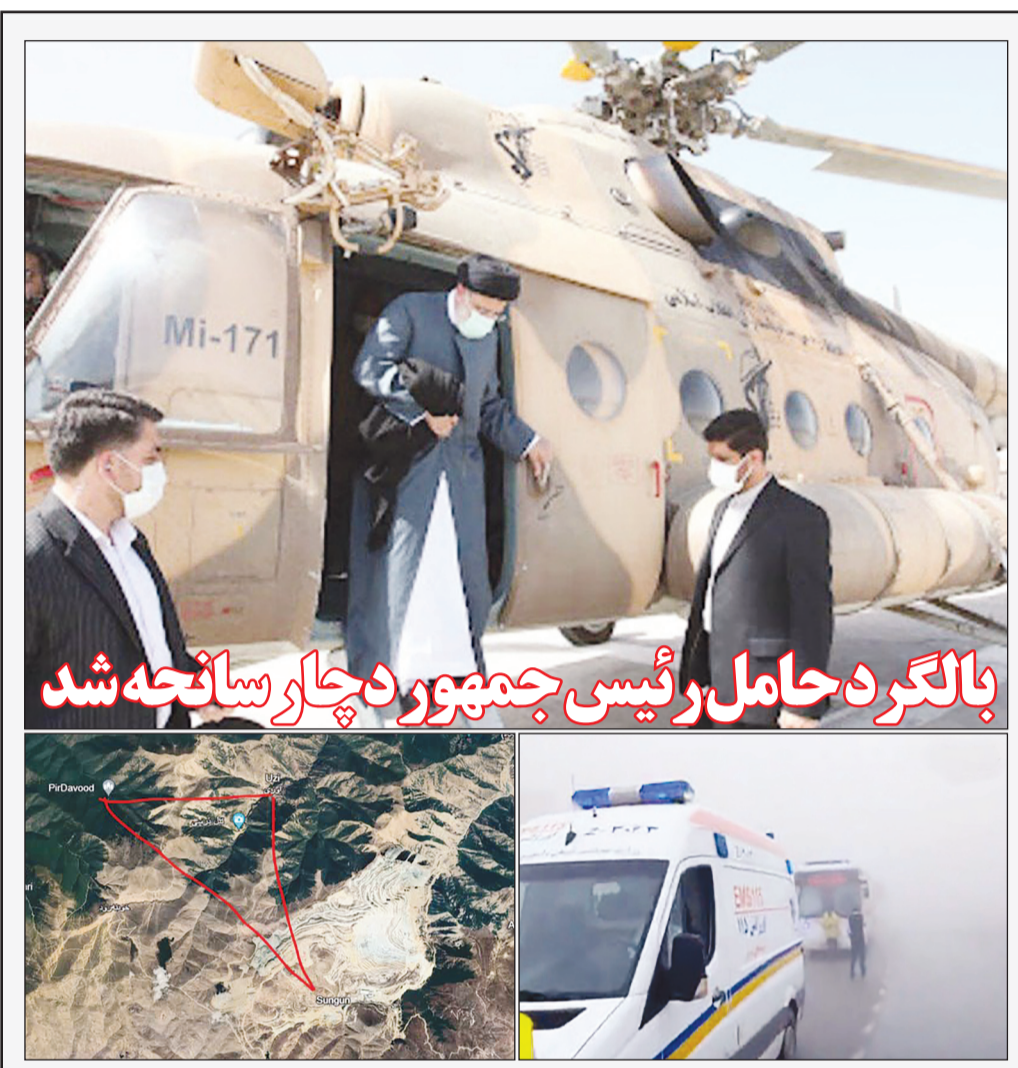
رئیس جمهور از طریق بالگرد به همراه کاروانی برای افتتاح سد قیز قلعه سبی به جلفا رفته بود که بالگرد ایشان دچار حادثه شد. ۳۳ بالگرد کاروان او را به تبریز باز می‌گرداندند. علاوه بر مرگ، بارندگی هم باعث کندی تیم جستجو شده بود. (تا لحظه ارسال صفحات به چاپخانه خبر جدیدی از تیم جستجو ارسال نشده بود.)

وزیر علوم: سرعت در جذب اعضای هیات علمی رتبه دانشگاه‌ها را تغییر می‌دهد گزارش محققان استرالیایی؛ مردان بیشتر از زنان در برابر دیابت آسیب پذیرند وزارت بهداشت اعلام کرد؛ اعلام شرایط تحصیل دانشجویان ایرانی در دو دانشگاه قبرسی و لهستانی