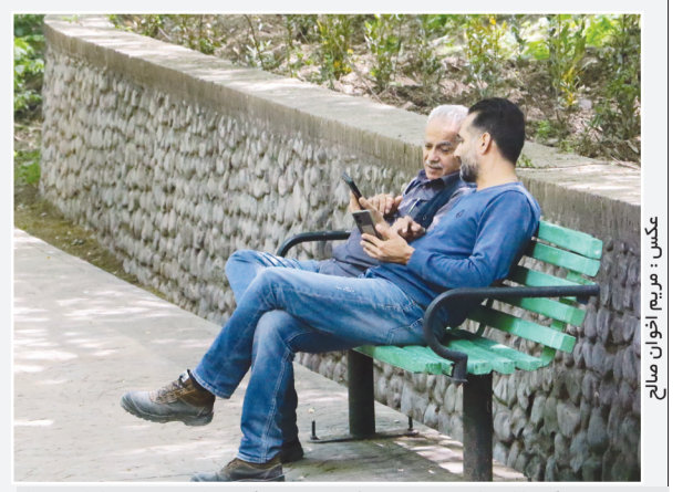
یک مطالعه بلندمدت جدید نشان می‌دهد که مردان نسبت به زنان در برابر اثرات ناتوان‌کننده دیابت آسیب پذیرتر هستند. بر اساس گزارش محققان، میزان کلی دیابت بین مردان و زنان مشابه است. اما محققان دریافتند که بیماری قلبی، اختلالات چشمی، مشکلات کلیوی و عوارض ساینی و پاپیو، صرف نظر از مدت زمانی که به دیابت مبتلا بوده‌اند، در مردان بیشتر است.