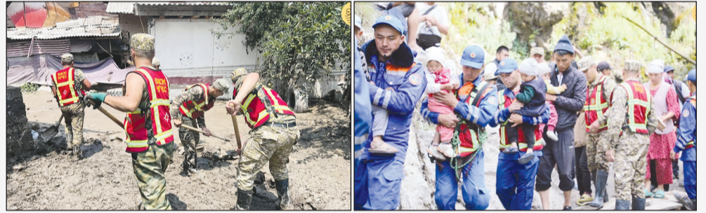
گزارش ها حاکی از کشته شدن ۱۲ نفر در سیل ناشی از بارندگی شدید در جنوب قرقیزستان است. بر اساس بیانیه وزارت اورژانس قرقیزستان، بر اثر بارش شدید باران در مناطق اوش و باتکن سیل رخ داد که جان ۱۲ نفر را گرفت.