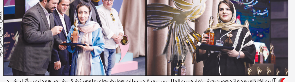
آئین اختتامیه دوازدهمین جشنواره بین المللی سیمرغ در سالن همایش های علوم پزشکی شهر همدان برگزار شد.