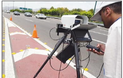
سقف خلافی که منجر به توقیف خودرو می شود از ۲ تومن به ۵ میلیون تومان رسید.

وی افزود: در گذشته مبلغی که باعث توقیف خودرو می شد رقم ۲ میلیون تومان بود که در زمان کرونا این رقم موقتا به ۲ میلیون تومان رسید. رئیس پلیس راهور فراجا خاطرنشان کرد: در نتیجه اگر خودرویی رقم جریمه اش به ۵ میلیون تومان برسد منجر به شکایت پلیس و در نهایت توقیف و انتقال به برای توقیف خودرو، خبر داد. به گزارش تسنیم، سردار تیمور حسینی، گفت: با توجه به افزایش جرائم رانندگی سقف خلافی که منجر به توقیف خودرو می شود از ۲ تومن به ۵ میلیون تومان رسید. وی اظهار کرد: با توجه به افزایش جرائم رانندگی