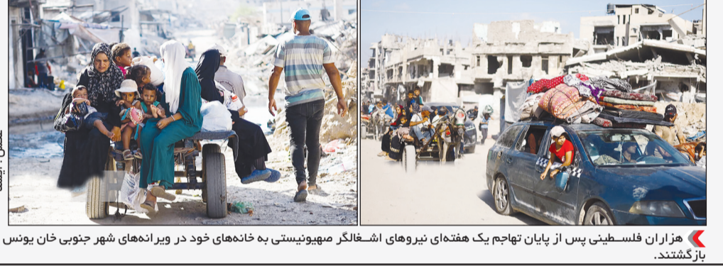
هزاران فلسطینی پس از پایان تهاجم یک هفته ای نیروهای اشغالگر صهیونیستی به خانه های خود در ویرانه های شهر جنوبی خان یونس بازگشتند.