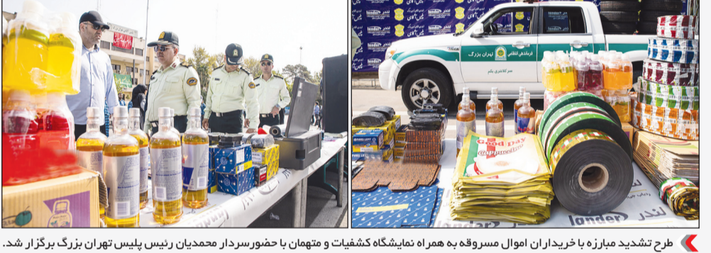
طرح تشدید مبارزه با خریداران اموال مسروقه به همراه نمایشگاه کشفیات و متهمان با حضور سردار محمدیان رئیس پلیس تهران بزرگ برگزار شد.