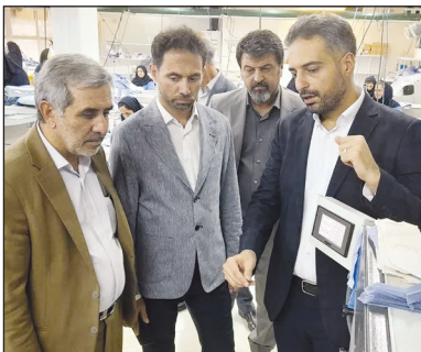
صمت، ارز واحدهای صنعتی و تولیدی در این رابطه

تأمین شده و صف انتظار دریافت ارز برای تأمین مواد اولیه تقریباً به صفر رسیده است. گرجی ادامه داد: بیشتر مواد اولیه شامل انواع الیاف پنبه، ویسکوز و در حلقه‌های بعدی، نخ تأمین و برای تأمین ماشین‌آلات نیز وقفه کوتاهی که در سال گذشته صورت گرفت، با ارزیابی و بررسی‌های بعدی با کمک انجمن‌های تخصصی در حال تأمین است. این مسئول بیان کرد: فروریز از قطب‌های تولید صنعت نساجی کشور به حساب می‌آید که بهترین واحدهای نساجی کشور را درون خود جای داده است. در صنعت نساجی استان قزوین، تمام زنجیره تولید از بافندگی، رنگ‌رزی و پوشاک درون آن فعال است.