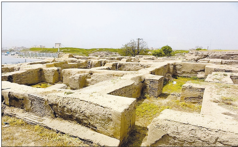
او گفت: همدان پتانسیل خوبی در حوزه گردشگری دارد و امیدوارم که به‌زودی شاهد آن باشیم که همدان به قطب گردشگری کشور تبدیل شود.