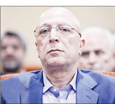
دستمزد را تشکیل داده (فوق العاده ویژه) مصوب و عملیاتی شود که این جا حق با یاوران علمی است.

وزیر علوم آخرین وضعیت فوق العاده ویژه کارکنان آموزش عالی را توضیح داد و گفت: اکنون برای مصوب عملیاتی شدن فوق العاده ویژه کارکنان باید شورای حقوق و دستمزد تشکیل شود. محمد علی زلفی گل در گفتگو با مهر درباره آخرین وضعیت فوق العاده ویژه کارکنان آموزش عالی گفت: بحث فوق العاده ویژه کارکنان آموزش عالی به صورت ششماهه در پیگیری درجیم. وی ادامه داد: یکی از گروه های بحث مذکور در سازمان امور استخدامی و سازمان برنامه و بودجه بود که این فوق العاده ویژه را برای اکثر وزارت خانه ها انجام داده بودند ولی برای وزارت علوم با وجود پیگیری های زیادی که انجام شد، اکنون به شورای حقوق و دستمزد رسیده است. وزیر علوم افزود: باید شورای حقوق و