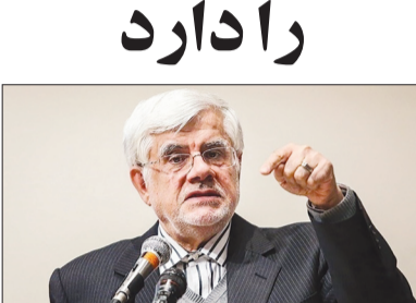
معاون اول رئیس جمهور با بیان اینکه رویکرد

برادرانه و با قبول این که یک هدف و یک کار داریم، قانون برنامه هفتم به عنوان میساق ملی را اجرا کند، گفت: این که آیا احکامی از برنامه هفتم باید اصلاح شود یا نه، بحث فنی و کارشناسی است. ما قوانین را وحی منزل نمی‌دانیم ولی اجرای قوانین را یک اصل می‌دانیم.