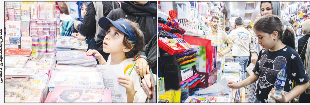
با نزدیک شدن به اول مهر ماه و بازگشایی مدارس، بازار بزرگ تهران شاهد حضور بسیاری از خانواده‌ها برای تهیه لوازم مورد نیاز دانش‌آموزان می‌باشد.