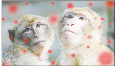
جایی که بیشتر مورد نیاز است، نیاز به افزایش فوری تولید، تهیه، کمک‌های مالی و توزیع وجود دارد. ماه گذشته، سازمان بهداشت جهانی آبله میمون را یک مسئله بهداشتی اورژانسی در جهان اعلام کرد که بالاترین سطح هشدار است که این سازمان می‌تواند صادر کند. امسال بیش از ۱۴۰۰۰ مورد ابتلا به این ویروس با

۵۲۴ مرگ و میر مشاهده شده است که افزایش قابل توجهی در موارد گزارش شده در مقایسه با سال ۲۰۲۲ است. اگوست گذشته، مرکز کنترل و پیشگیری از بیماری‌های آفریقا اعلام کرد که شیوع آبله میمون‌ها در پی بیش از ۵۰۰ مرگ، یک وضعیت اضطراری بهداشت عمومی است و خواستار کمک‌های بین‌المللی برای جلوگیری از گسترش این ویروس شد. شایان ذکر است که ویروس آبله میمون از طریق تماس قابل انتقال است و این بیماری در موارد نادر ممکن است منجر به مرگ شود. از علائم آن می‌توان به سردرد، درد عضلانی، درد پشت، ضعف و تورم غدد لنفاوی اشاره کرد. موارد آبله میمون در چندین کشور آفریقای به ویژه جمهوری دموکراتیک کنگو، برونیدی، کنیا، رواندا و اوگاندا گسترش یافته است.