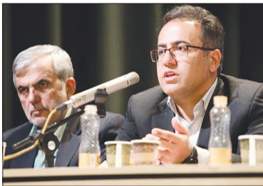
طرحی هستیم که طبق نظر وزیر علوم یک ریل گذاری متفاوت در آینده پارکها باشد.

وی افزود: ما نمی توانیم نهادهایی را ایجاد کنیم که از اثربخشی و خروجی موثر را در زیست بوم آموزش عالی کشور نداشته باشد. بدون تردید اعتقادی که داریم این است که پارک های فناوری هر چه رشد پیدا کنند، در نتیجه آن تأمین منابع مالی هم برای ما و هم دانشگاه ایجاد می شود و حتماً مدل اجرای آن را نهایی خواهیم کرد.