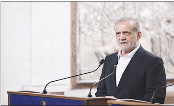
مراسم بازگشایی دانشگاه ها تا پایان این هفته مشخص خواهد شد و دفتر رئیس جمهوری هماهنگی های این برنامه را انجام می دهد؛ اگر چه معاونت فرهنگی

معاون فرهنگی و اجتماعی وزارت علوم از مشخص شدن برنامه رئیس جمهور برای حضور در مراسم آغاز سال تحصیلی دانشگاه ها تا پایان هفته جاری خبر داد.