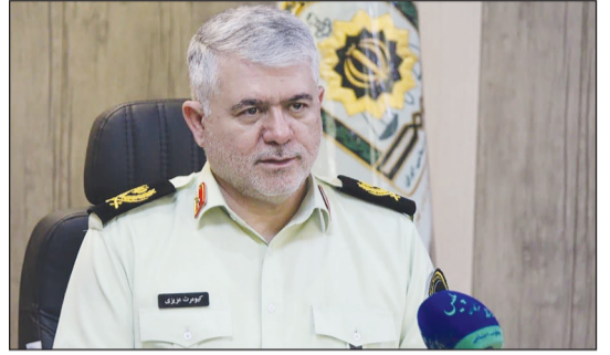
شهرستان قدس-مژگان علیقارداشی

فرماندهی انتظامی غرب استان تهران: میزبانی شهرقدس برای برگزاری بازی‌های آسیایی موجب افتخار است