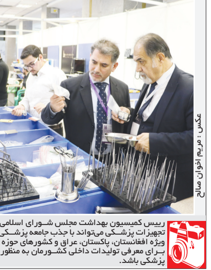
رئیس کمیسیون بهداشت مجلس شورای اسلامی گفت: برگزاری نمایشگاه‌های تجهیزات پزشکی می‌تواند با جذب جامعه پزشکی و تاجران کشورهای خارجی به ویژه افغانستان، پاکستان، عراق و کشورهای حوزه خلیج فارس، فرصت مناسبی برای معرفی تولیدات داخلی کشورمان به منظور توسعه صادرات تجهیزات پزشکی باشد.

اسرائیل ۵ شهر و روستای دیگر را منطقه بسته نظامی اعلام کرد رژیم صهیونیستی پنج شهر و روستای دیگر در امتداد مرز سرزمین‌های اشغالی با لبنان را به عنوان مناطق بسته نظامی اعلام کرد. به گزارش نیویورک تایمز، این روستاها که ماه‌ها پیش تخلیه شده بودند، در امتداد یک بخش تقریباً هفت مایلی از مرز کشیده شده‌اند که غربی‌ترین نقطه آن از سواحل مدیترانه آغاز می‌شود. این بیانیه در پی هشدارهایی است که اوایل روز دوشنبه به غیرنظامیان لبنان برای دوری از سواحل این کشور صادر شد. با صدور آخرین اعلامیه، به نظر می‌رسد اسرائیل مرزهای اراضی اشغالی با لبنان را از منتهی‌الیه شرقی و غربی خود محصور کرده است.