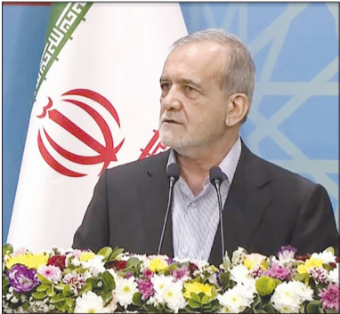
پروتکل‌ها توجهی ندارد. رسالت دانشگاه و دانشگاهی این است که کشور ما را در قله علم، توانایی، هنر و تکنولوژی قرار دهد.

رئیس جمهور با اشاره به دوران جوانی خود، بیان کرد: زمانی که جوان بودم، ذهن خود را معطوف آن کردم که در رشته‌ای تحصیل کرده و کسب مهارت کنم که نیاز و کمبود آن در کشور شدید است تا بتوانم مشکلات مردم را در آن حوزه حل کنم. وی ادامه داد: ما باید مشکلات را در داخل کشور خود حل کنیم. بنده حتی برای تکمیل دوره‌های به خارج از کشور رفتم تا بتوانم آنچه که در کشورهای توسعه یافته اتفاق می‌افتد را بتوانیم به داخل ایران منتقل کنیم.