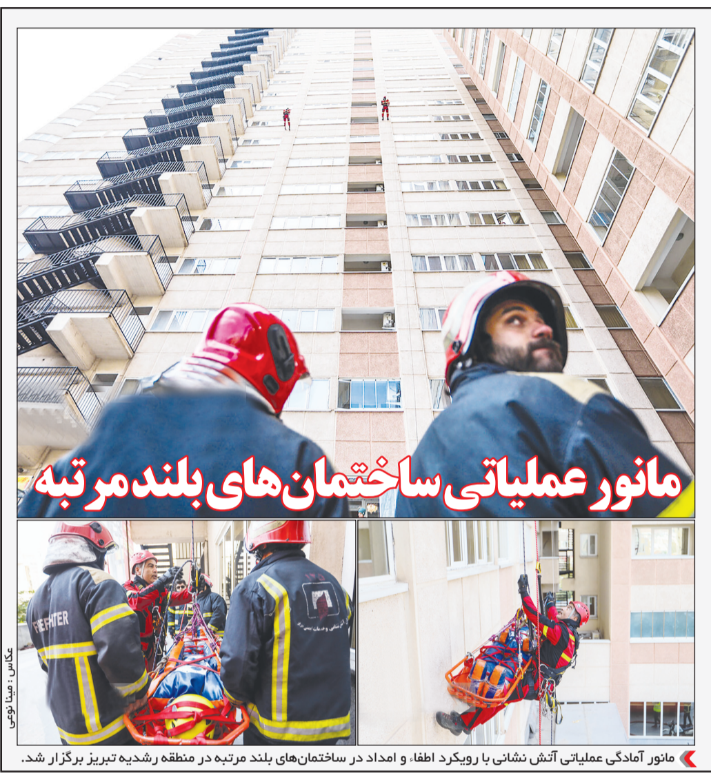
مانور عملیاتی ساختمان های بلندمرتبه

احتمال تحریم چین به بهانه ارسال تسلیحات به روسیه نیبه بری: ترامپ برای آتش بس در لبنان چراغ سبز نشان داده است