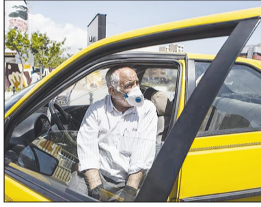
شهردار تهران را از رویکردهای سازمان تاکسیرانی عنوان کرد و افزود: این خدمات، در چارچوب بودجه

وزیر جهاد کشاورزی درباره رفع تعهد ارزی در موضوع پسته نیز اضافه کرد: این موضوع هماهنگی بین دستگاهی است و هماهنگ می‌کنیم که برای سال بعد این مسئله رفع شود. وی از مجتمع مس سرچشمه رفسنجان خواست