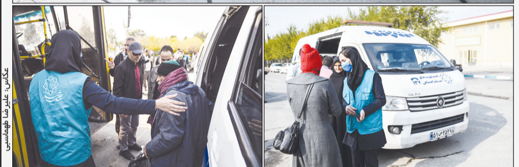
طرح ساماندهی آسیب های اجتماعی در سطح بهشت زهرا (س) با همکاری سازمان خدمات اجتماعی و مشارکت یگان حفاظت، کلانتری ۲۰۵ حرم مطهر امام خمینی (ره) و سازمان بهزیستی آغاز شد. طرح ساماندهی آسیب های اجتماعی از هفته جاری آغاز شده و به مدت ۱۰ روز ادامه خواهد داشت.