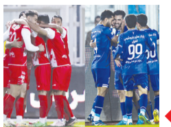
روزهای شلوغ استقلال و پرسپولیس در آذر

آغاز ثبت نام متولدین سال ۱۴۰۲ برای دریافت سهام رایگان شرایط توزیع نیروهای متعهد خدمت فوق تخصصی پزشکی سال ۱۴۰۳ اعلام شد پوتین فرمان استفاده گسترده تر از سلاح های هسته ای را امضا کرد