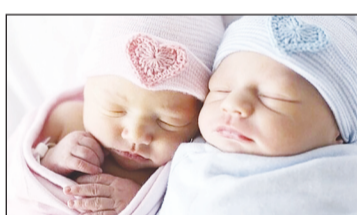
مالی لازم برای خرید سهام این گروه از نوزادان سالانه از طریق قوانین بودجه تامین می گردد. نکته قابل توجه اینکه، اسامی تمامی متولدین سال ۱۴۰۲ در سامانه ملی خدمات دولت هوشمند وجود دارد و با ورود کد ملی متولد ۱۴۰۲ اطلاعات فرد مشاهده و مراحل ثبت نام انجام می شود. سهام تا سن ۲۴ سالگی فرزند به همراه سود بلوکه خواهد بود و توجه داشته باشند که الگوی مصرف از ۳۰۰ کیلووات ساعت به زیر ۲۰۰ کیلووات ساعت در ماه رسید، در صورتی که مصرف خود را کنترل نکنند مشمول تعرفه های بالاتر که پلکانی - افزایشی و نزدیک هزینه های تأمین برق است خواهند شد.

۲۴ سالگی ازدواج کند می تواند زودتر از وقت مقرر از سهام خود استفاده کند. بر این اساس با توجه به آغاز ثبت نام متولدین سال ۱۴۰۲ برای خرید سهام صندوق های قابل معامله در بورس، مسأله ماده (۱۱) قانون حمایت از خانواده و جوانی جمعیت، والدین این کودکان با مراجعه به پنجره ملی خدمات دولت هوشمند به نشانی my.gov.ir وارد کردند که محل کودک در «پنجره تشویق جوانی جمعیت»، مراحل ثبت نام را انجام دهند. ۱- والدین محترم از صبح بودن کد پستی در هنگام ثبت نام، اطمینان حاصل نمایند. ۲- والدین محترمی که از امتیاز افتتاح حداکثر دو حساب سپرده بانکی برای هر فرد زیر ۱۸ سال، برای فرزند متولد سال ۱۴۰۲ خود استفاده نموده اند، ابتدا می بایزد در سامانه «کاهش تعرفه واردات خودرو به ۶۰ درصد» را بررسی و تصویب کنند.