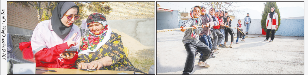
تعداد ۱۵۰ نفر جهادگر در عرصه‌های پزشکی، تخصص زنان، ماما، دندانپزشکی، پزشکی عمومی، داروی رایگان، روانشناس خانواده به مدت دو روز در روستای، نیشته خراسان شمالی حضور دارند.