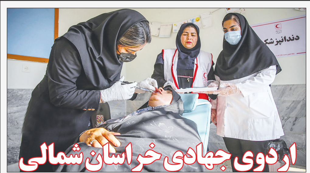
اردوی جهادی خراسان شمالی

افزایش ۲۸ درصدی تعرفه برق برای تمامی مشتریان