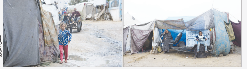
فلسطینیان ساکن در چادرهای آوارگان در اردوگاه نمیرات واقع در بخش مرکزی نوار غزه، جایی که اسرائیل به حملات خود ادامه می دهد، با بارش شدید باران و سرمای هوا در منطقه دست و پنجه نرم می کنند.