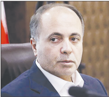
در این حوزه نیازمند تقویت بیشتر هستیم. وی افزود: در اصلاح ساختار سازمان تحقیقات،

نمایشگاه بین المللی پژوهش، فناوری و فن بازار هر ساله در هفته پژوهش با اهداف شناخت نیازهای پژوهشی و فناوری، ارتقای رقابت‌ها در این حوزه، ارائه جدیدترین دستاوردها، گردهمایی محققان، پژوهشگران و فن‌آوران، فراهم کردن شرایط تجاری سازی فناوری، ایجاد ارتباط میان مراکز پژوهشی و فناوری برگزار می‌شود.