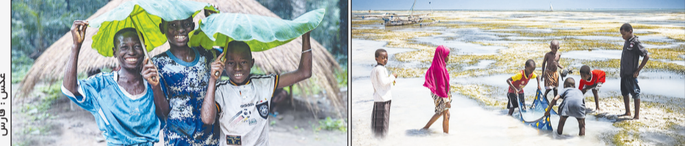
آفریقا قاره ای با فرهنگهای بسیار گوناگون است. این قاره با ۱۳۳۳ میلیارد نفر جمعیت تا سال ۲۰۲۱، حدود ۱۸ درصد از جمعیت جهان را تشکیل می داد. جمعیت آفریقا در میان تمام قاره ها جوان ترین محسوب می شود. میانگین سنی در سال ۲۰۱۲ برابر ۱۹.۷ سال بود. زمانی که میانگین سنی در سراسر جهان ۳۰.۴ سال ثبت شده بود. در آفریقا حضور کودکان در جای جای این قاره، بیش از همه جا در دنیا به چشم می آید.