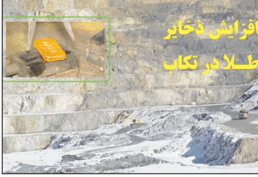
مدیر عامل شرکت معدنی طلای زرشوران تکاب گفت: با افزایش ظرفیت تولید طلا، در این معدن یک قرن دیگر طلا تولید می‌شود.

رئیس منابع طبیعی و آبخیزداری شهرستان کلات گفت: بدون شک بارش‌های اخیر در احیای مجدد جنگل پسته خواجه کلات و بزرگ‌ترین جنگل پسته وحشی خاورمیانه تأثیر خوبی خواهد داشت.