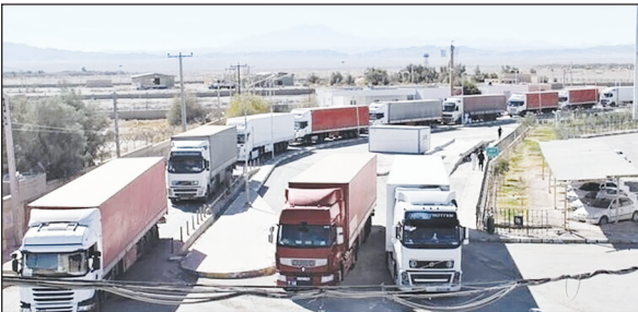
مبدأ را به خود اختصاص دادند. عسگری اظهار کرد: در این مدت

طبق اعلام رئیس گمرک، ترانزیت خارجی از مسیر ایران در ۹ ماهه سال جاری با ۳۱ درصد افزایش به رقم ۱۶ میلیون و ۵۰۰ هزار تن رسید. به گزارش ایسنا، فرود عسگری -معاون وزیر امور اقتصادی و دارایی - گفت: گمرکات شهیدرجایی، پرویزخان و باشماق سه گمرک عمده مبدأ ترانزیت بودند که در ۹ ماهه سال جاری بیشترین میزان کالاهای ترانزیتی در بین گمرکات