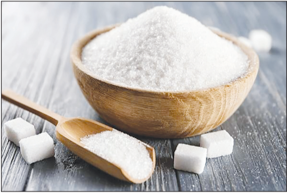
یک میلیون و ۸۰۰ هزار تن شکر از چندترکند بهاره، پاییز و نیشکر استحصال شود.

بنابر آمارهای اعلامی وزارت جهاد اسما یک میلیون و ۸۰۰ هزار تن شکر در کشور تولید شد که بر این اساس بزودی در تولید شکر خودکفا خواهیم شد. به گزارش باشگاه خبرنگاران جوان؛ بنابر آمار سالانه ۲ میلیون و ۲۰۰ تا ۲ میلیون و ۳۰۰ هزار تن شکر مورد نیاز است که اسما ۱۰ درصد تولید یک میلیون و ۸۰۰ هزار تن شکر در داخل، در تامین ۹۰ درصد شکر مورد نیاز خودکفا هستیم و تنها ۱۰ درصد نیاز کشور باید از طریق واردات تامین شود که با مدیریت واردات، توسعه کشت پاییزه و عدم دخالت دولت در قیمت خرید تضمینی چندترکند و شکر امکان دستیابی به خودکفایی وجود دارد.