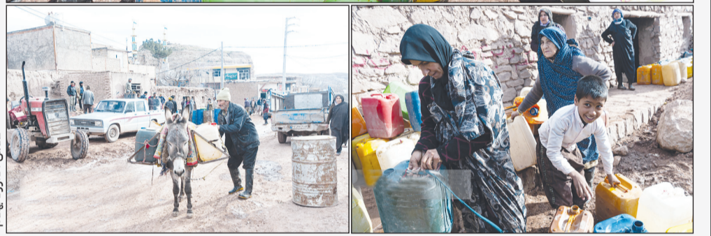
روایت فصل سرما در روستای مارشک

روستای مارشک (خراسان رضوی) با جمعیتی حدود ۵۰ خانوار در دل رشته کوه‌های هزار مسجد و در فاصله ۸۰ کیلومتری شمال مشهد واقع شده است. این روستا به دلیل موقعیت کوهستانی، دمایی حدود ۱۰ درجه سردتر از مشهد دارد و اقتصاد آن عمدتاً بر پایه دامداری و کشاورزی استوار است. تاکنون مردم این روستا و شش روستای همجوار در محور مارشک، با چالش‌های طبیعی مانند سیل و یخبندان دست و پنجه نرم کرده و نتوانسته‌اند به عنوان سوخت استفاده می‌کنند. پیش‌بینی می‌شود که پروژه گازرسانی به این منطقه طی ۶۳ روز کاری به بهره‌برداری برسد و مشکل دیرینه سوخت در این منطقه را برطرف کند.