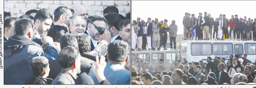
مسعود پزشکیان رئیس جمهور در سومین سفر استانی دولت چهاردهم، به استان سیستان و بلوچستان سفر کرد.