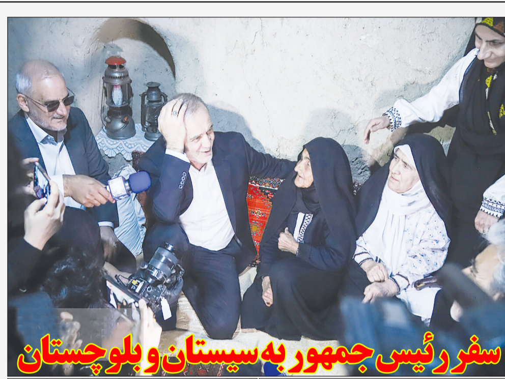
سفر رئیس جمهور به سیستان و بلوچستان

وزیر امور خارجه ترکیه با اشاره به اینکه کشورش هیچ طمعی به خاک سوریه ندارد، بر تداوم همسایگی خوب با ایران و تمایل آنکارا به گسترش روابط همه جانبه با تهران تأکید کرد. وزیر امور خارجه ترکیه در سخنانی با اشاره به گروه‌های «پکک/ای‌پ‌گ» در سوریه گفت که کشورش قدرت، توانایی و عزم راسخ برای از بین بردن تمامی تهدیدات علیه خود از سوی این گروه‌ها را دارد.