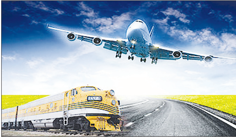
وزیر راه و شهرسازی بخشی از توافقات روسای جمهور دو کشور ایران و روسیه را شامل

موضوعات مرتبط با حمل و نقل ریلی، هوایی و دریایی و جاده‌ای در بخش کالا و مسافر عنوان کرد.