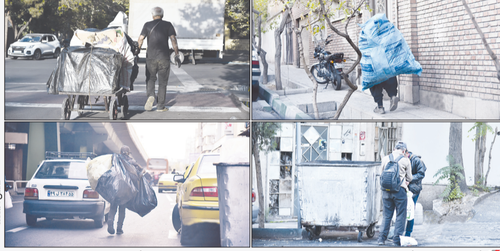
اگرچه امرار معاش، گرمای تابستان و سرمای زمستان نمی شناسد، اما دیدن برخی صحنه ها غم انگیز است؛ دیدن مرد، زن و کودکی که با کوله باری بر دوش در خیابان های شهر به امید کسب درآمد، زباله گردی می کنند؛ دیر زمانی است این حکایت را اکثریت فقط نظاره می کنند.