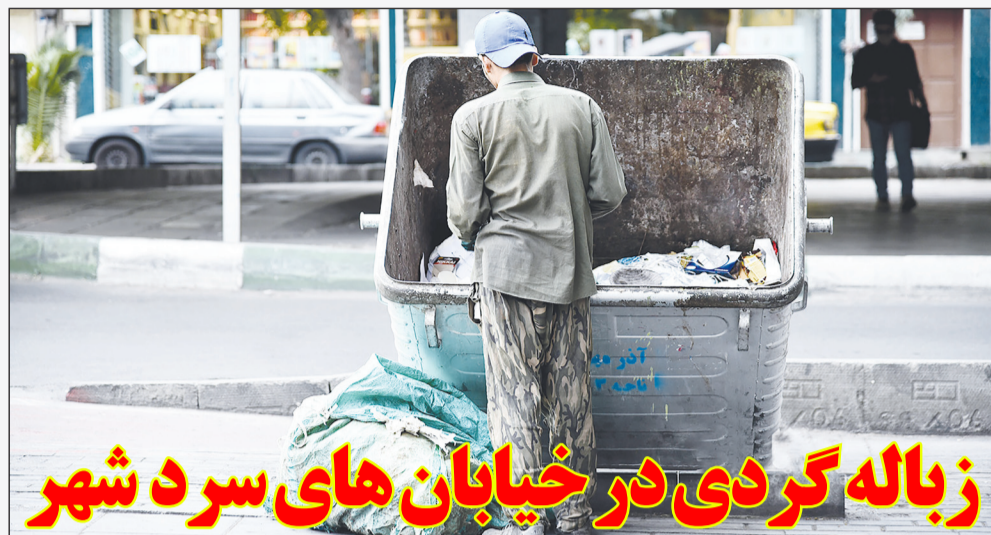
زباله گردی در خیابان های سرد شهر

شاید آنچه از تیر این مطلب به ذهن خطور می کند تصویری از چند زن و مرد سن و سال دار و یک نخه سیاه روی یک مندی باشد که در قالب بی سوادان یا نهضت سواد آموزی شناخته می شوند. اما حقیقت این مطلب اشاره به کودکان و دانش آموزانی است که در سنین یادگیری هستند و در عین حال که به مدرسه می روند دچار بی سوادی خاموش هستند. این مسئله را طی مدت اخیر با اخبار مربوط به آمار آزمون تیمز مشاهده کردیم که طبق نتایج این آزمون، ۲۱ درصد از دانش آموزان ایران عملکرد بسیار ضعیفی دارند و از هر ۵ دانش آموز، ۲ نفر چیزی یاد نمی گیرند. البته این مسئله زمانی نگران کننده می گردد که به سبب تعطیلات مختلف مدارس به سبب آلودگی یا سرمای هوا، روند کیفی آموزش ها به طور جدی افت می کند. این مسئله را بسیاری از خانواده ها مشاهده می کنند که بعضا دانش آموزان از داخل رخت خواب با گوشی در کلاس حاضر می شوند و با حالتی غیر متمرکز پای صحبت های معلم می نشینند، البته اگر خوابشان نبرد. شکی نیست جدای این مسئله محتوای آموزشی و روش های به کار گرفته شده در سیستم آموزشی عامل جدی در کاهش سطح دانش فرزندان ایران گردیده است. اگر این مسئله را جدی نگیریم جدای از اینکه آینده این بچه ها به سمت تباهی خواهد رفت، در نگاهی کلان کشور از نیروی انسانی کیفی بی بهره خواهد شد. اگر امروز بدر دانش تکاریم فردا حاصلی نخواهیم داشت، این را باید جدی گرفت.