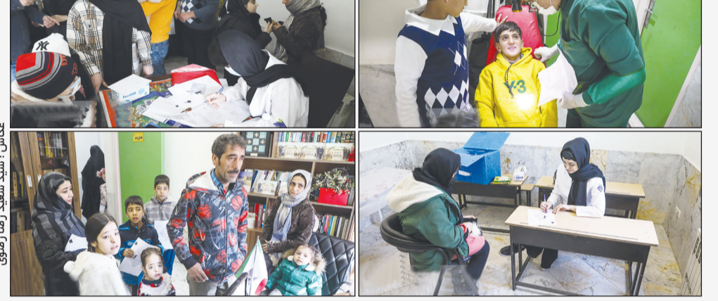
گروه‌های جهادی با حضور در منطقه صالح آباد تهران، خدمات دندان پزشکی، مشاوره، پزشک زنان اطفال و عمومی و توزیع رایگان دارو به ساکنین منطقه ارائه دادند.