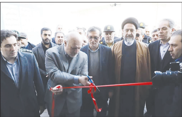
نشاط اجتماعی و سلامت عمومی شهروندان منجر می‌شود.

شهردار اندیشه در پایان ضمن تاکید بر برنامه‌های توسعه‌ای این شهر از اجرای پروژه‌های جدید در حوزه‌های مختلف خاطر نشان کرد: بهره‌برداری از این دو مجموعه سرانه ورزشی و خدماتی شهر اندیشه افزایش یافته و گامی دیگر در راستای توسعه پایدار شهری برداشته شده است و امیدواریم با اجرای پروژه‌های بیشتر نیازهای شهروندان را هرچه بهتر بر طرف کنیم.