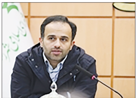
رشت-سیدهد حدیث میرزاده

پروژه تقاطع غیرهمسطح آیت‌الله رودباری که یکی از طرح‌های عمرانی مهم در راستای کاهش گره‌های ترافیکی و تسهیل در عبور و مرور شهری محسوب می‌شود به پیشرفت ۵۵ درصدی رسید.