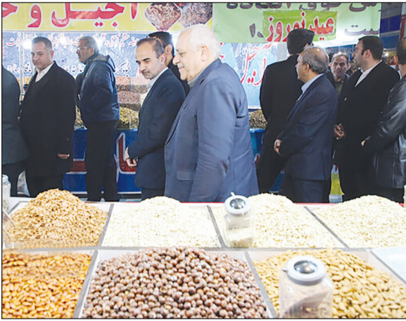
همچنین طبق اعلام رئیس شهر برگزار شود.

همچنین در این نمایشگاه کالاهای اساسی، آجیل، خشکبار، پوشاک، کیف و کفش و غیره عرضه خواهد شد و مهم‌ترین شاخه نمایشگاه بهاره این است که فقط کالاهای تولید داخل در آن عرضه می‌شود.