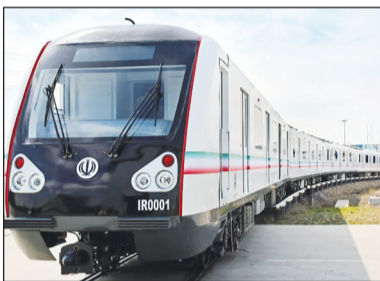
فروش بلیت‌ها نیز به این صورت خواهد بود که امروز چهارشنبه (هشتم اسفندماه) همه مسیرها

به گفته این مقام مسئول، برای این ایام دو میلیون و ۲۰۰ هزار صندلی برای مسافران ایجاد شده که نسبت به مدت مشابه سال قبل ۱۰ درصد رشد داشته است.