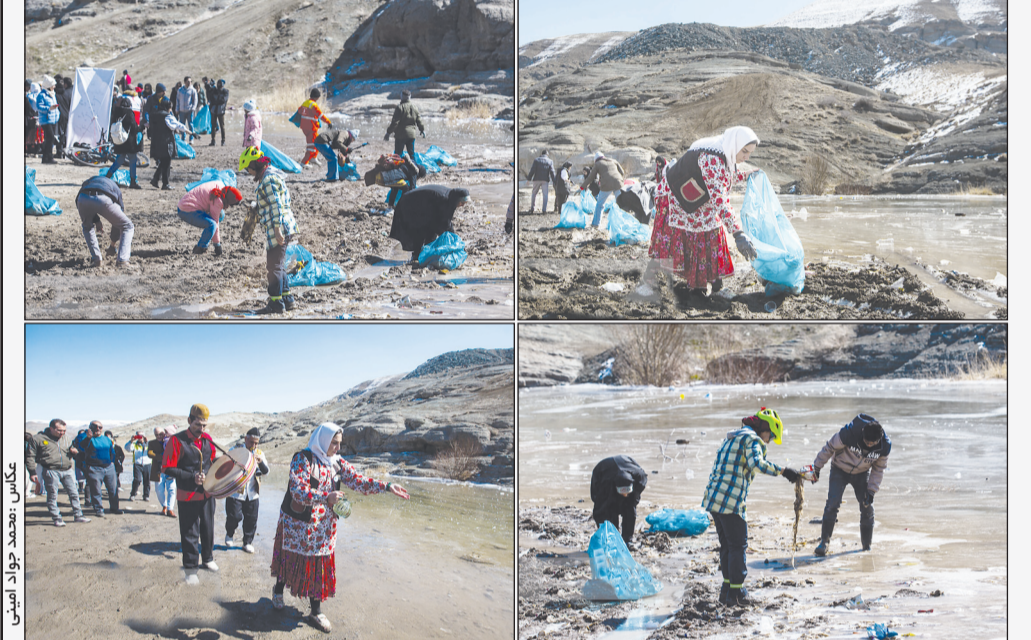
جشن نوروز رودخانه جشنی شاد برای لاریبی و پاکسازی رودخانه‌ها، کاریزها و چشمه‌ها در ایران باستان بوده که در این جشن ایرانی پس از آب شدن برف‌ها، ایرانیان به کنار رودخانه می‌رفتند و رودها را پاکسازی و آن‌ها را برای فرارسیدن بهار آماده می‌کردند. و پس از بهسازی و لاریبی در رودها و پیرامون آن گل، گلبرگ و کلاب می‌ریختند و با این کار از رودها برای روان‌شدن دیواره‌شان سپاسگزاری می‌کردند.