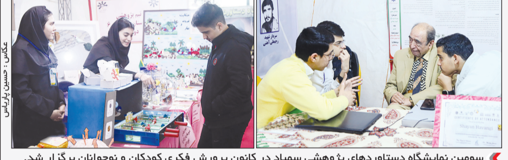
سومین نمایشگاه دستاوردهای پژوهشی سمپاد در کانون پرورش فکری کودکان و نوجوانان برگزار شد.