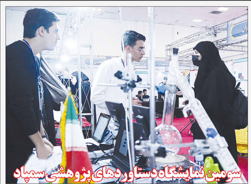
سومین نمایشگاه دستاوردهای پژوهشی سمپاد