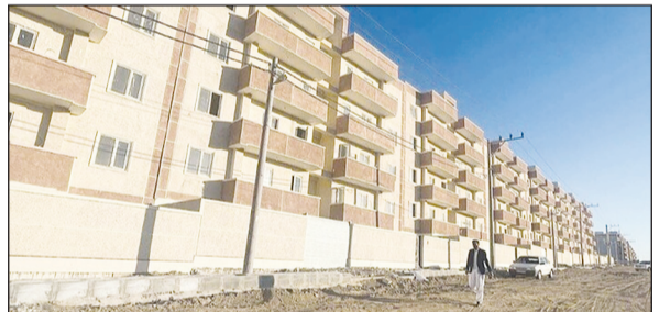
بهارستان، نگارستان، شمس، آوین و شهید تجلایی از متقاضیان خواست

مدیر عامل شرکت عمران سهند از افتتاح ۱۰۰۰ واحد مسکن ملی در شهر جدید سهند در خرداد ماه خبر داد. به گزارش مهر، فرهاد سعیدی گفت: ۱۰۰۰ واحد مسکونی از پروژه‌های مسکن ملی در شهر جدید سهند با پیشرفت فیزیکی بیش از ۸۵ درصد آماده تحویل است که برنامه‌ریزی برای افتتاح این واحدها در خرداد ماه انجام شده است.