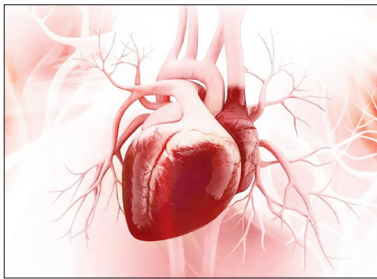
دریاب‌های فعالیت در طول یک هفته ردیابی کرد و دریافت افرادی که فعالیت‌های شدیدتری یا با شدت

بر اساس مطالعه جدید محققان دانشگاه سیدنی استرالیا، برای کسانی که فرصت انجام تمرین‌های ورزشی ساختاریافته را ندارند، کارهای روزانه و فعالیت‌های تند ممکن است همپوشانی برای آنها مفید باشد. به گزارش مهر به نقل از شینپو، این مطالعه، بیش از ۲۴۰۰۰ بزرگسال را که ورزش رسمی انجام نمی‌دادند مورد بررسی قرار داد. این مطالعه نشان داد که فعالیت بدنی متوسط تا شدید، مانند کارهای خانه با سرعت بالا، پیاده روی سریع، یا حمل مواد غذایی، با کاهش قابل توجهی در خطر ابتلاء به بیماری‌های قلبی عروقی مرتبط است. این مطالعه شرکت‌کنندگان را از طریق