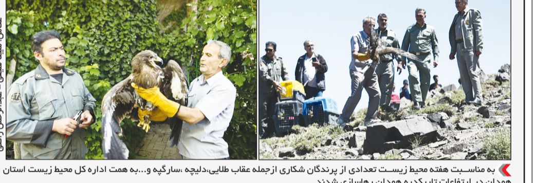
به مناسبت هفته محیط زیست تعدادی از پرندگان شکاری از جمله عقاب طلایی، دلیجه، سارگپه و... به همت اداره کل محیط زیست استان همدان در ارتفاعات تاریکدره همدان رهاسازی شدند.