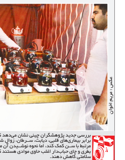
بررسی جدید پژوهشگران چینی نشان می دهد که جای می تواند به محافظت در برابر بیماری های قلبی، دیابت، سرطان، زوال شناختی و از دست دادن عملیات مرتبط با سن کمک کند. اما نحوه نوشیدن آن مهم است و چای های آماده در طعمی و جای صابردار اغلب حاوی موادی هستند که می توانند فواید چای را برای سلامتی کاهش دهند.

اعلام بر نامه زمان بندی بر گزاری آزمون های نهایی تیر و مرداد ۱۴۰۵ مرکز ارزشیابی و تضمین کیفیت نظام آموزش و پرورش، برنامه زمان بندی بر گزاری آزمون های نهایی تیر و مرداد ۱۴۰۵ را اعلام کرده. به گزارش ایسنا، مرکز ارزشیابی و تضمین کیفیت نظام آموزش و پرورش در راستای تحقق هدف عملیاتی ۱۹ سند تحول بنیادین آموزش و پرورش و اجرای راهکار «ایجاد سازوکارهای قانونی و ساختار مناسب برای سنجش و ارزشیابی عملکرد نظام تعلیم و تربیت رسمی و عمومی»، برنامه زمان بندی آزمون های نهایی تیر و مرداد سال ۱۴۰۵ را منتشر کرد. بر اساس این برنامه، آزمون های نهایی پایه های یازدهم و دوازدهم برای دانش آموزان دوره روزانه، بزرگسالان، آموزش از راه دور، ایثارگران، داوطلبان آزاد و مدارس خارج از کشور در رشته های شاخه نظری دوره دوم متوسطه برگزار خواهد شد. همچنین متقاضیان ایجاد یا ترمیم سابقه تحصیلی می توانند مطابق برنامه اعلام شده در این آزمون ها شرکت کنند. مرکز ارزشیابی و تضمین کیفیت نظام آموزش و پرورش از تمامی داوطلبان خواسته است ضمن مطالعه دقیق برنامه زمان بندی، تمهیدات لازم را برای حضور به موقع در آزمون ها مدنظر قرار دهند.