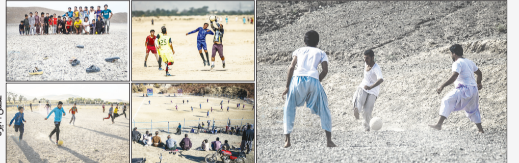
همزمان با آغاز رقابت های جام جهانی زمین های فوتبال در نقاط مختلف ایران نیز رنگبویی متفاوت به خود گرفته اند. این چند عکس، لفظهایی از شور، هیجان و دلپسندی مردم به محبوب ترین ورزش جهان را به تصویر می کشد؛ لفظهایی که در آن فوتبال فراتر از یک بازی ظاهر می شود و به نمادی از امید، رقابت و رهیاهای مشترک تبدیل می شود. فابهایی که نشان می دهند تب جام جهانی، پیش از سوت نخستین سلیقه، در زمین های فوتبال و میان علاقمندان این ورزش جریان یافته است.