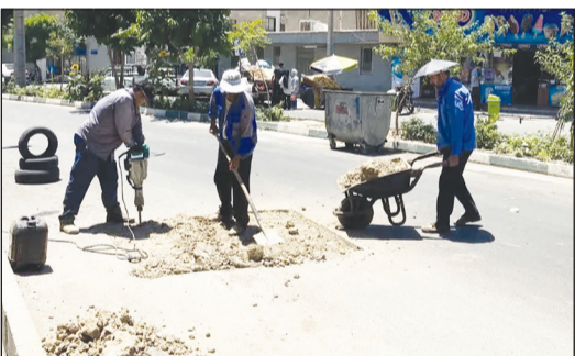
شهرستان قدس - مژگان علیقارداشی

در راستای ارتقای کیفیت زیرساخت‌های شهری و بهبود وضعیت عبور و مرور شهروندان، عملیات مرمت و بهسازی آسفالت پنج معبر دیگر در نقاط مختلف شهر قدس توسط معاونت امور زیربنایی و ترافیک شهرداری قدس به اجرا درآمد.