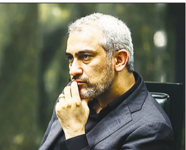
وی افزود: همچنین استفاده از صندوق‌های بازاری

وی اضافه کرد: در هفته جاری، وزارتخانه‌ها و دستگاه‌های مرتبط فهرست بنگاه‌ها را در اختیار ما قرار می‌دهند و ما نیز آن را برای اقدام و اجرا به سیستم بانکی و همچنین بورس اوراق بهادار ابلاغ خواهیم کرد.