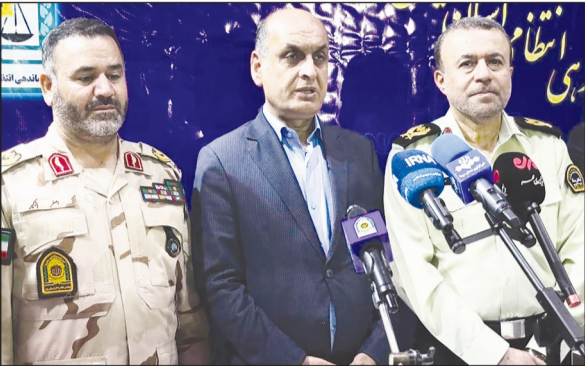
رشت- سیده حدیث میرزاده

مراسم امحای ۲ تن مواد مخدر مکشوفه در گیلان با حضور هادی حق‌شناس استاندار گیلان، سردار حسین حسن‌پور فرمانده انتظامی استان و جمعی از مدیران دستگاه‌های اجرایی، مسئولان انتظامی، امنیتی و قضایی برگزار شد.